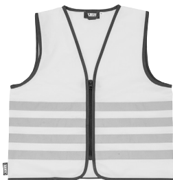
JC6800 LEON Lumino Reflex Vest