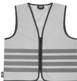
JC6900 MAX Lumino Urban Vest